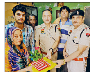
सोनीपत। शहीद पुलिस कर्मी के परिजनों को सम्मान देते हुए पुलिस अधिकारी।