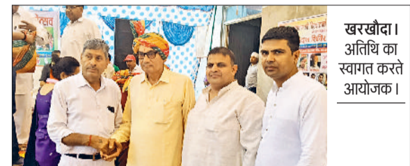
खरखौदा। अतिथि का स्वागत करते आयोजक।

शहर में भगवान विश्वकर्मा दिवस धूमधाम से मनाया गया। जिसमें मॉट्टो बाईपास पर हवन, रक्तदान शिविर व भंडारे का आयोजन किया गया। जिसका आयोजन जांगड़ा वेलफेयर सोसाइटी खरखौदा के तत्वावधान में किया गया। विधायक पवन खरखौदा ने मुख्य अतिथि के रूप में कार्यक्रम में शिरकत की। अपने उद्बोधन में उन्होंने कहा कि भगवान विश्वकर्मा सृष्टि के रचयिता हैं। जिन्होंने देवताओं के भी निवास व नगरी बनाने का कार्य किया। भगवान विश्वकर्मा ऐसे शिल्पकार हैं।