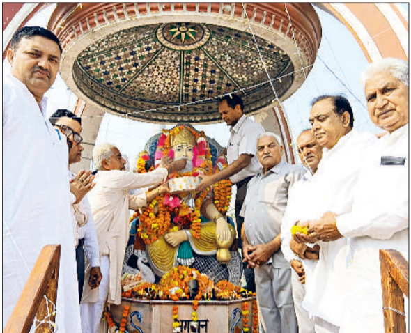
भगवान विश्वकर्मा की प्रतिमा पर माल्यार्पण करके नमन करते महाराज के सदस्य।