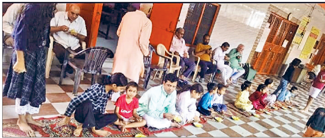
सोनीपत। नरेंद्र नगर स्थित शिव मंदिर में प्रसाद ग्रहण करते श्रद्धालु।

प्रभातफेरी के पश्चात सभी भक्तगण शिवमंदिर पहुंचे, जहां विधिवत गोवर्धन पूजा संपन्न हुई। पूजा के बाद अन्नकूट का निर्माण किया गया और कढ़ी-चावल का भंडारा