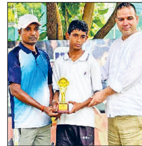
गोहाना। विजेता खिलाड़ी अपने कोच के साथ।