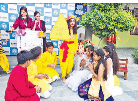
सोनीपत। ज्ञान गंगा मांटेसरी एवं मॉडल स्कूल में भगवान श्रीकृष्ण की गोवर्धन लीला का मंचन करते बच्चे।

ज्ञान गंगा मांटेसरी एंड मॉडल स्कूल, न्यू नंदवानी नगर में गोवर्धन पूजा के अवसर पर बच्चों को भगवान श्रीकृष्ण और गोवर्धन पर्वत की पौराणिक कहानी से अवगत कराया गया। छात्र-छात्राओं ने लघु नाटिका के माध्यम से बताया कि भगवान श्रीकृष्ण की लीलाएं अनंत हैं और हर लीला में गहरा आध्यात्मिक संदेश छिपा है। ऐसी ही एक अद्भुत लीला है गोवर्धन धारण की, जिसमें बाल गोपाल ने अपनी एक उंगली पर विशाल गोवर्धन पर्वत को उठाकर समस्त ब्रजवासियों की रक्षा की थी। यह कथा न केवल उनकी दिव्य शक्ति का प्रदर्शन करती है, बल्कि हमें अहंकार त्यागने और प्रकृति के प्रति सम्मान रखने का