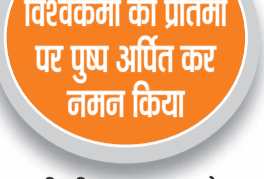
हरिभूमि न्यूज ►► गन्नौर